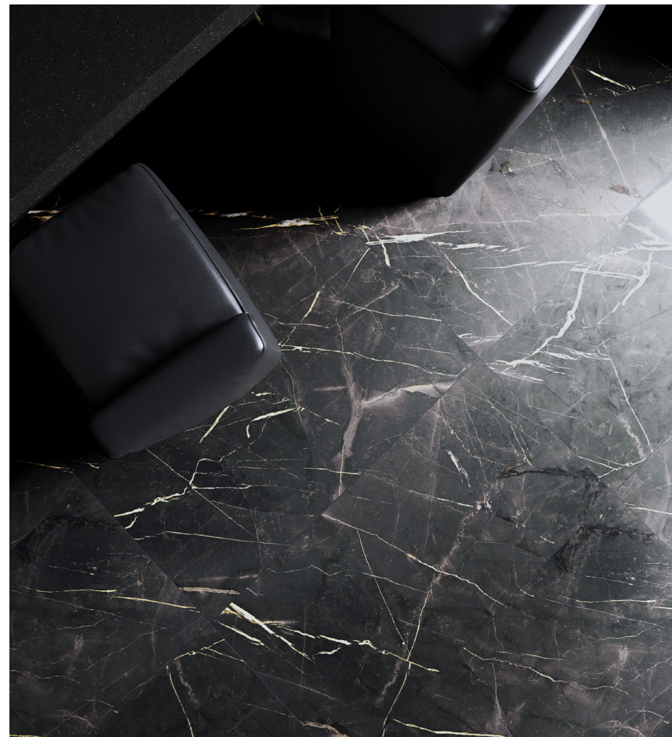
sahara poler 60x120 /rektyfikowana/