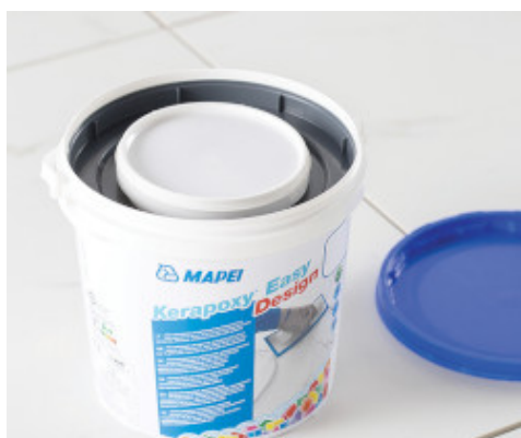
Oba składniki zaprawy dostarczane są zbiorczo w jednym wiaderku

Po wymieszaniu obu składników, jak opisano powyżej, nakładać klej na podłoże za pomocą odpowiedniej pacy zębatej. Układać płytki/mozaikę, lekko je dociskając i przesuwając. Po ostatecznym związaniu klej uzyskuje bardzo wysoką wytrzymałość mechaniczną i chemiczną.