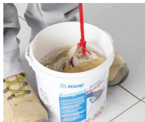
Oba składniki należy dokładnie wymieszać ze sobą