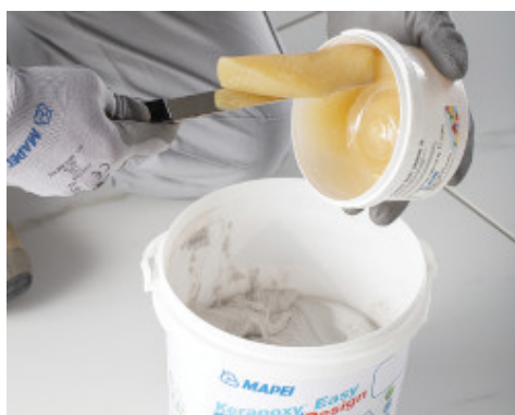
Utwardzacz (składnik B) należy przełożyć do pojemnika zawierającego składnik A