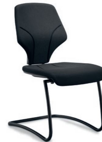
64-3003 → Cantilever → Frame, powder-coated