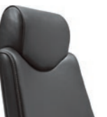
Fixed headrest Poggiatesta fisso

giroflex 64 – Swivel chair: The executive armchair is available with comfort upholstery, wide seat, high backrest (on request: covered). Optionally with depth-adjustable lumbar support. Diverse cover materials in various colours. With fixed or 3D armrests, headrest in two different versions and coat-hanger. Polished or powder-coated aluminium 5-arm base in diverse colours. Castors \varnothing 50 mm or optionally \varnothing 65 mm.