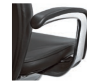
Armrests, upholstered Braccioli imbottiti