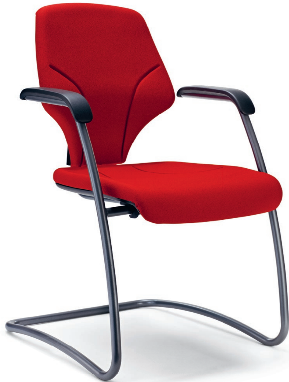
64-7003 → Cantilever → Armrests → Frame, powder-coated