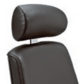
Adjustable headrest Poggiatesta regolabile