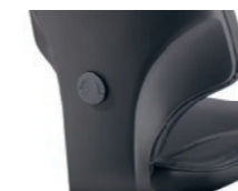
Depth-adjustable lumbar support Supporto lombare regolabile in profondità

* 1D = height-adjustable regolabili in altezza 3D = height-, width- and depth-adjustable regolabili in altezza, larghezza e profondità