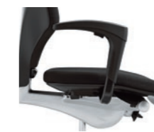
1D armrests*, not upholstered Braccioli 1D*, non imbottiti