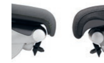
Standard upholstery (left); comfort upholstery (right) Imbottitura standard (sinistra), imbottitura comfort (destra)