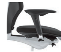
3D armrests*, not upholstered Braccioli 3D* non imbottiti