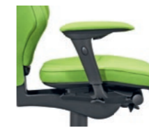
3D armrests*, upholstered Braccioli 3D* imbottiti

* 1D = height-adjustable regolabili in altezza 3D = height-, width- and depth-adjustable regolabili in altezza, larghezza e profondità