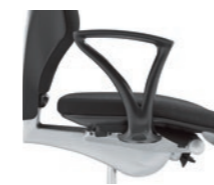
Fixed armrests, not upholstered Braccioli fissi non imbottiti

Tutte le possibilità di configurazione sono disponibili sul configuratore online su www.giroflex.com .