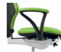
Fixed armrests, upholstered Braccioli fissi imbottiti