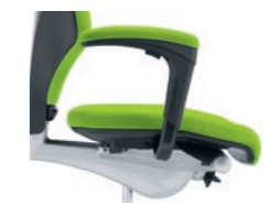
1D armrests*, upholstered Braccioli 1D*, imbottiti