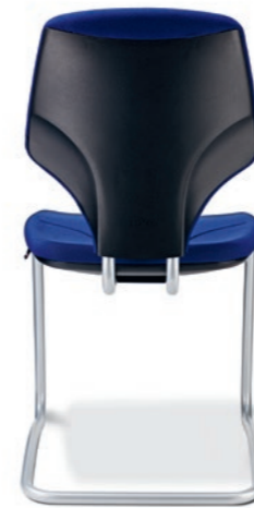
64-3003 → Cantilever → Frame, powder-coated

Lasciate una buona impressione. Con questa sedia, il visitatore diventa un ospite. I modelli accattivanti con cantilever valorizzano ogni ambiente. La sedia visitatore giroflex 64 è disponibile in diversi materiali di rivestimento e colori e, a scelta, con o senza braccioli. Opzionalmente è proposta anche con parti in acciaio cromate.